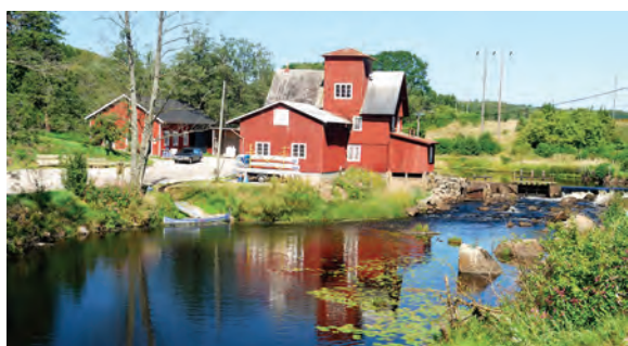
Västanå kvarn.

At Gonarp along the River Holje there is a natural waterfall with a height of 6 metres. In 1929, Gonarps Kraft AB applied for the right to build a power station here. In the same year a headrace channel was built by hand west of the River Holje. The power station is still in operation (disruptions to operations have occurred) and it has a power output of 230 kW. The generation of electricity provides heating for approx. 50 single-family dwellings.