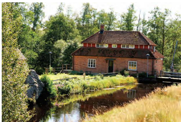
Gonarps kraftstation.

On the opposite side of Lillån just where the forest becomes arable land, you will find the remains of the mediaeval castle Björkeberg. The peculiar geological formations in the area really do provide food for the imagination! According to legend, recorded in the 17th century by Pastor Jöns Sorbonnius, this is the area where King Tidrich ruled. According to Jöns, the castle was built in a similar manner to that of Bäckaskogs Slott. It has also been said that King Tidrich's queen was unfaithful with King Atte at Brattingsborg – a fortress that was situated in Ivösjön, north-east of Ivön. King Tidrich wanted revenge and burned down his own fortress at Björkeberg where both King Atte and Tidrich's queen perished.