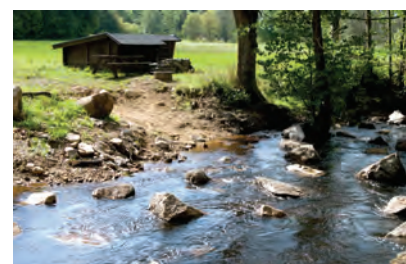
Naturreservatet Ljungaryda Östafors bruk.

Show consideration and care for the environment. Along the creek, there is a lot of cultivated land and grazing animals. Only put ashore at specially marked areas - it is permitted only in emergencies at any other area.