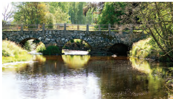
Västanå bro.

Västanå mill is located on the River Holje and is perhaps the oldest peasant industrial facility in the whole country which is still operational. According to the national archives in Copenhagen, the mill dates back to the year 1380. The mill is built of timber-frame walls but these days it is clad in red interlocking panelling. Additional buildings have been added in the north during the 1930s and in the south in 1971. The waterwheel has now been replaced by a turbine.