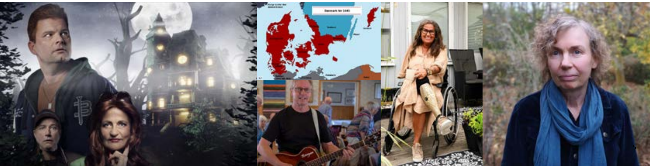
Foto: "Spöket på Canterville", Sverige-Danmark 1600", "Bengan", "Gittel Ullebo" - Roger Nellsjö, "Tuija Nieminen Kristofersson"