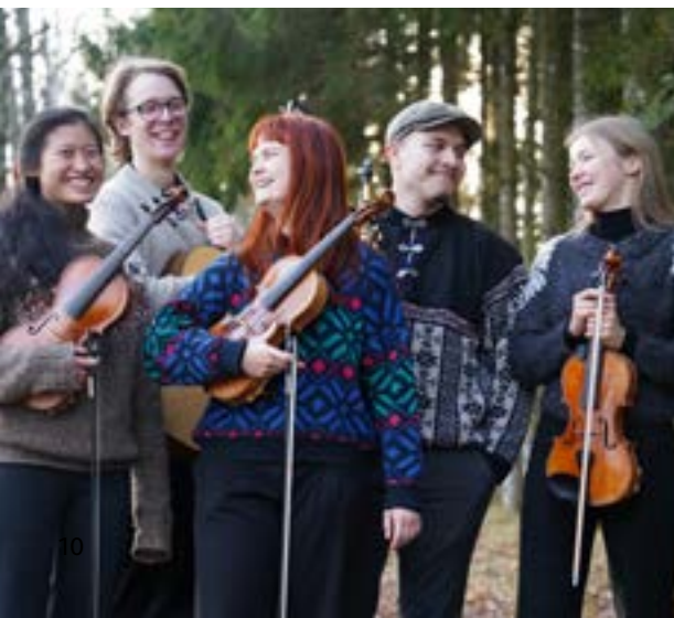
Foto: "Nordton", "Carling Sisters", "Gitte Pålsson" - Brian Babarik, "Stefan Nilsson" - BLT, "Tvåornas kör 2024"