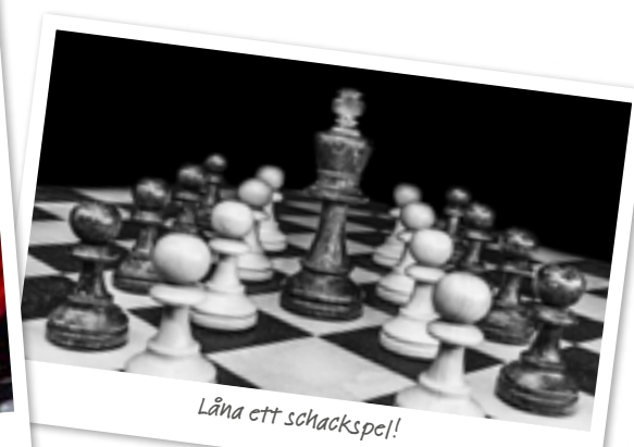
Låna ett schackspel!

Du hittar alla kontaktuppgifter på sidan tre!