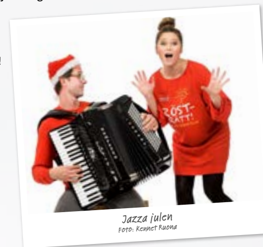
Jazza julen