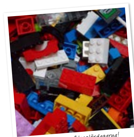
Kom och bygg på legolördagarna!