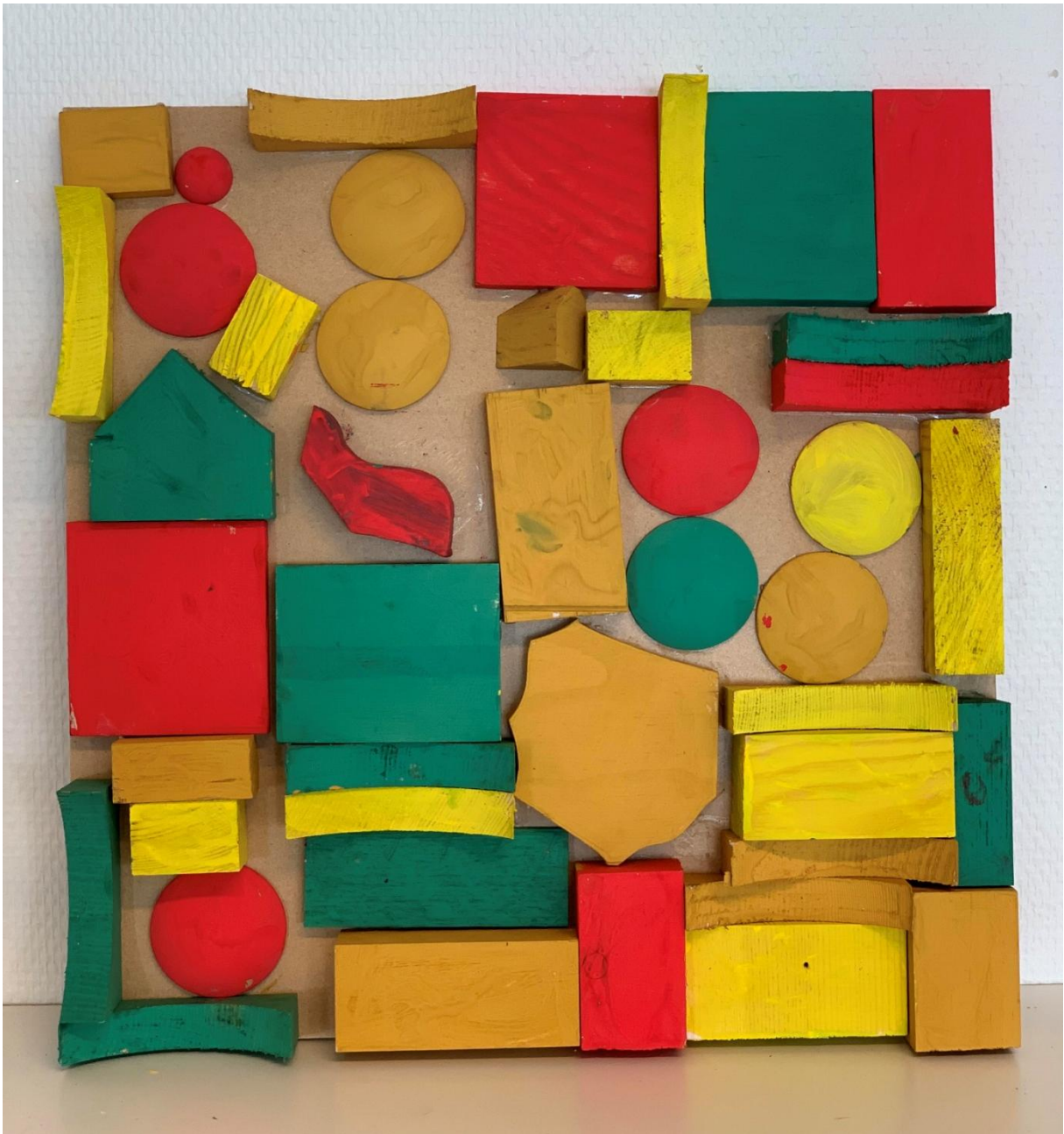
Tavlans namn: Mario-världen.

Det gröna är en skog. I skogen finns en björn. Det finns en polisbana i skogen där poliserna jagar tjuvar. Dom får hoppa över en massa glas.