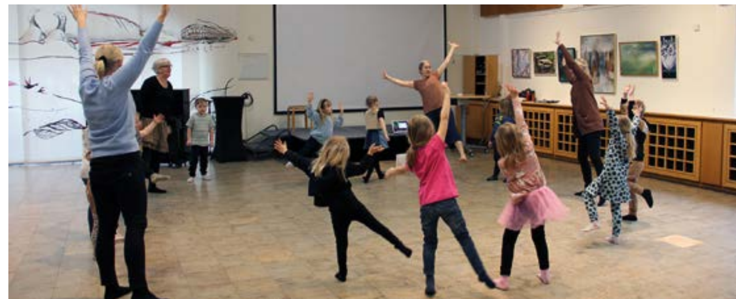
Barn från Humlelyckans förskola dansar boken "Lilla kotten får besök".