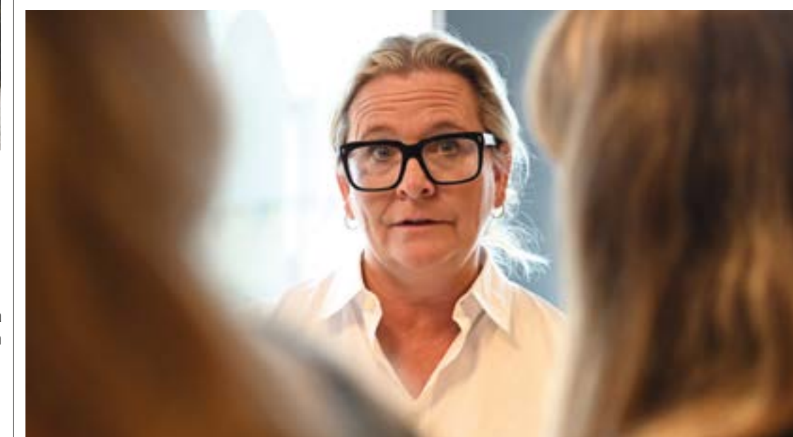
Rekryterare pratar med besökare på jobb- och utbildningsmässan.

Läs mer om Bromölla kompetens och deras arbete här: bromolla.se/bromollakompetens