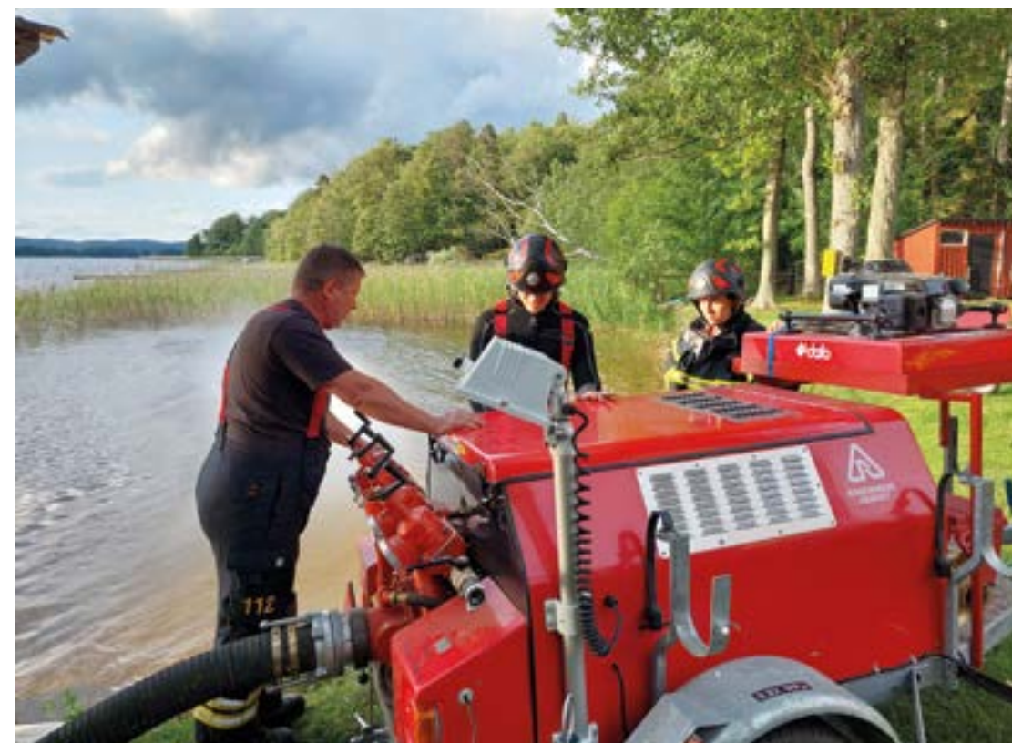
Räddningstjänsten i Bromölla på övningsuppdrag.