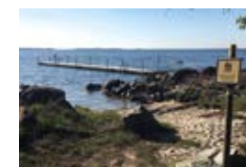
Vid Tomsabo badplats går Edenryds vandringsled.

Mer information om kommunens badplatser finns på bromolla.se/badplatser