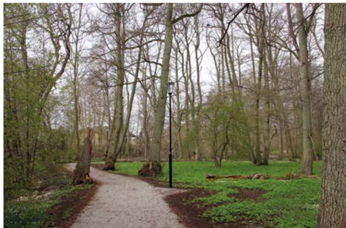
Vitsippor, träd och växter grönskar längs med Åfåran.