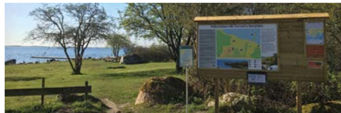
Informationsskylten vid Tomsabo badplats.