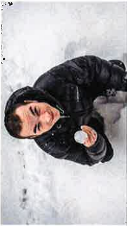
Snökaos – golfen flyttar inomhus - Sydstran Det går att spela golf, men snödjupet på Sölvesborgs GK ställer till det. Vad

Vad får man om man tar tre av trängens lokala idrottscenter och ber dem att beställa