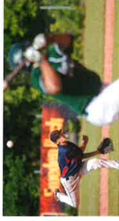
Bromölla kan få baseball-SM - Kristianstadsbladet Basebollklubben Sölvesborg Friidretts och inomhus nå kongress i Bromölla Nu har de ansökt om att få arrangera inne-SM för damer 2018