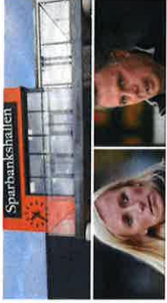
Tränartrio bjöd på hyllad föreläsning - Kristianstadsbladet

Vad får man om man tar tre av trängens lokala idrottscenter och ber dem att beställa