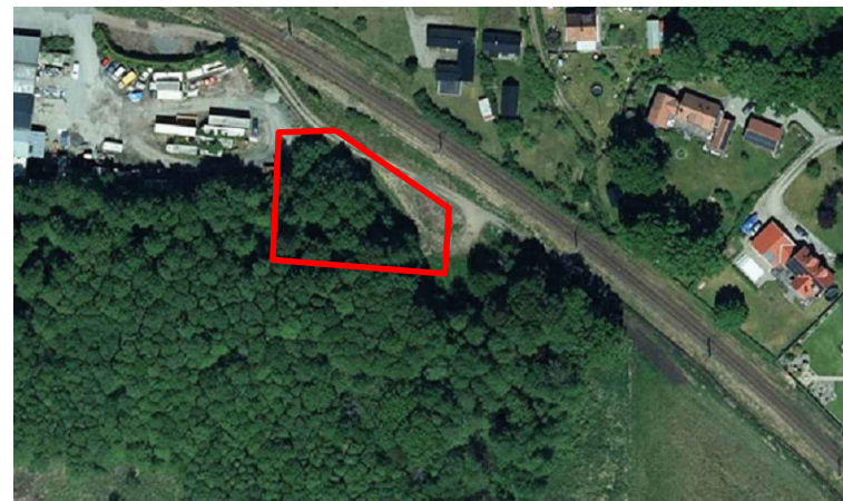
Orienteringskarta (ej skala)