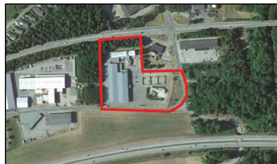
Flygfoto med markerat planområde (ej skala)