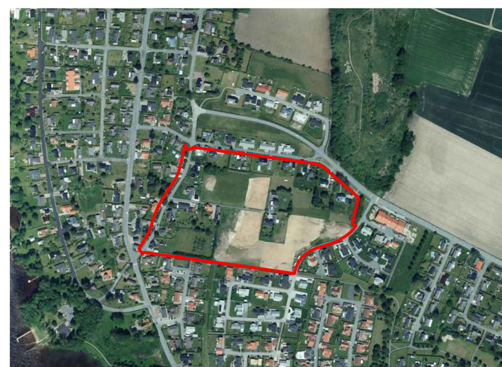
Orienteringskarta (ej skala)