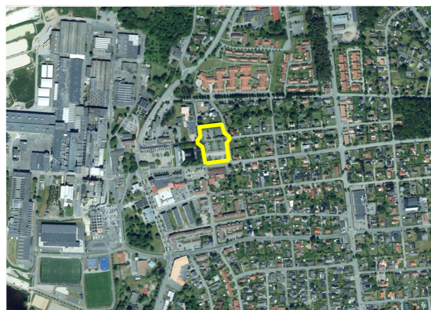
Orienteringskarta (ej skala)