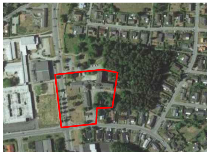
Orienteringskarta (ej skala)