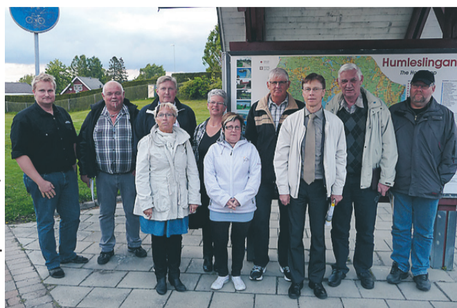
Aktiva företagare vill nu utveckla byn...