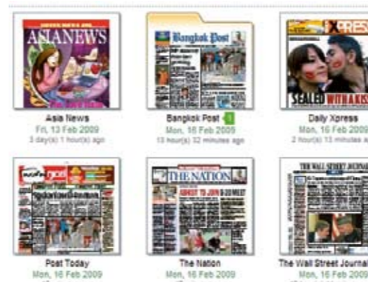
Några thailändska tidningar som finns i Library Pressdisplay

På Bromölla bibliotek kan man nu få tillgång till 800 tidningar på 40 språk från 80 länder via nättjänsten Library pressdisplay . Du får därmed möjlighet att även läsa bl a arabiska, isländska, holländska och kinesiska tidningar. Tidningarna är dagsfärska och du läser direkt på datorn som är placerad i tidningsrummet.