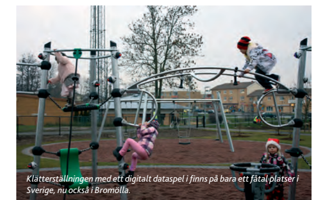
Klätterställningen med ett digitalt dataspel i finns på bara ett fåtal platser i Sverige, nu också i Bromölla.

För de stora finns två olika träningsmaskiner så att du kan passa på att träna samtidigt som du ser efter de små.