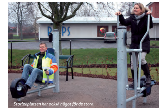
Storlekplatsen har också något för de stora.