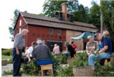
Humlelockning på Humletorkan.

Is the only of its kind in Scania and is renowned for its rare minerals. No mining has been done here since the mid-1870s.