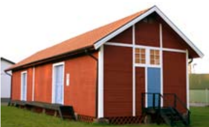
Godsmagasinet.

Näsums present church was completed in 1871, the church that had been built on the same site. The first one was built during the 13th century. The church's altar piece is known far and wide. It was painted by the Estonian national painter Johan Köler and was previously in place in the Swedish Katarina Church in Saint Petersburg.