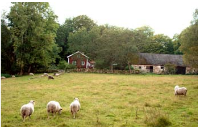
Rödihult, Jämshög. Foto: Tobias Delfin.

Översättning: Daccab. Foto: Tobias Delfin