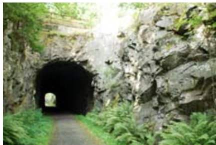
Barnakälla tunnel.

När järnvägen mellan Sölvesborg och Olofström anlades, byggdes Skånes enda järnvägstunnel vid Barnakälla. En varm sommardag ger tunneln lite svalka innan du snart åter är ute i solskenet. Barnakälla station användes främst för transport