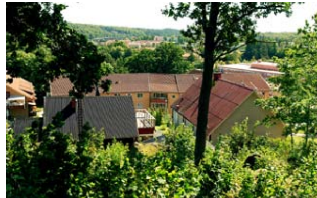
Himmelsberget Olofström.