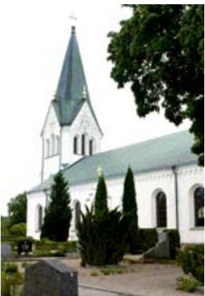
Näsums kyrka.