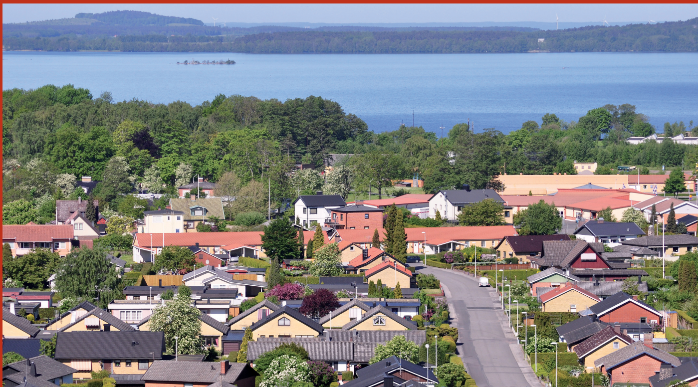
Vy över Bromölla.