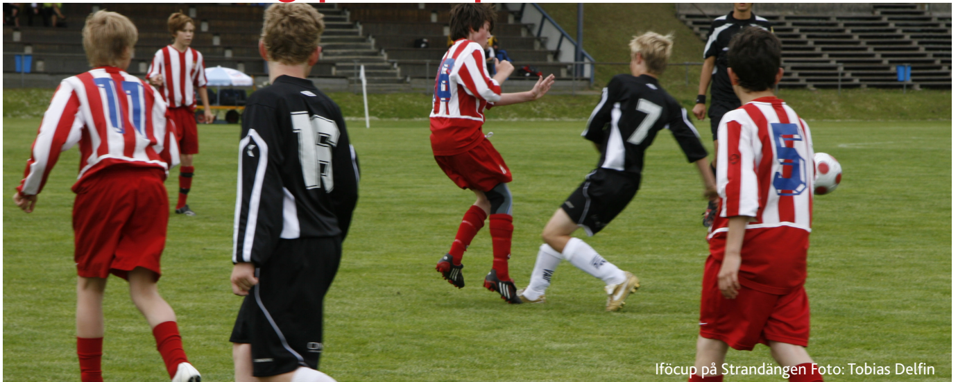
Iföcup på Strandängen