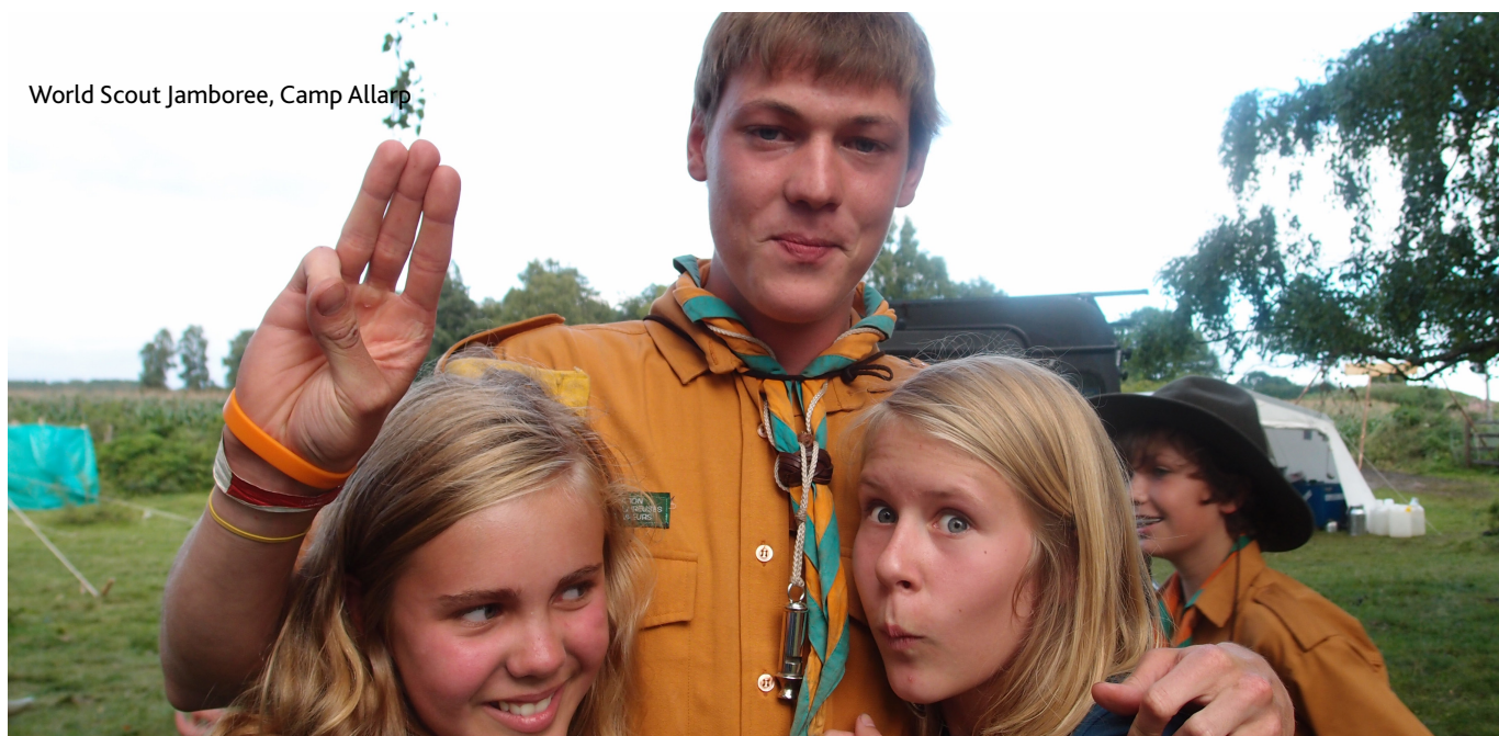
World Scout Jamboree, Camp Allarp

Simhallen är en viktig del av fritidsverksamheten i Bromölla med cirka 30 000 betalande besökare årligen, till detta kommer en stor simskoleverksamhet och föreningar som bedriver sin verksamhet där. Simhallen har öppet september - maj.