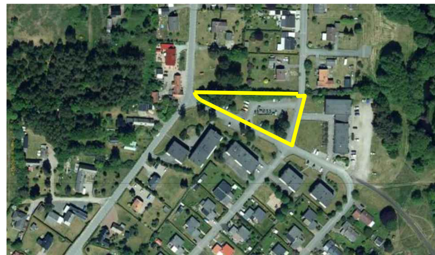
Orienteringskarta (ej skala)

GRUNDKARTA Upprättad av Kart och Mät, Bromölla kommun 2024-01-09 Avseende detaljplan för del av Gualöv 70:1 Koordinatsystem: SWEREF99 13 30 Höjdsystem: RH2000 Edita Zidziuniene Mättningsingenjör BETECKNINGAR